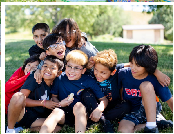
Zeit für eine Gruppenumarmung!