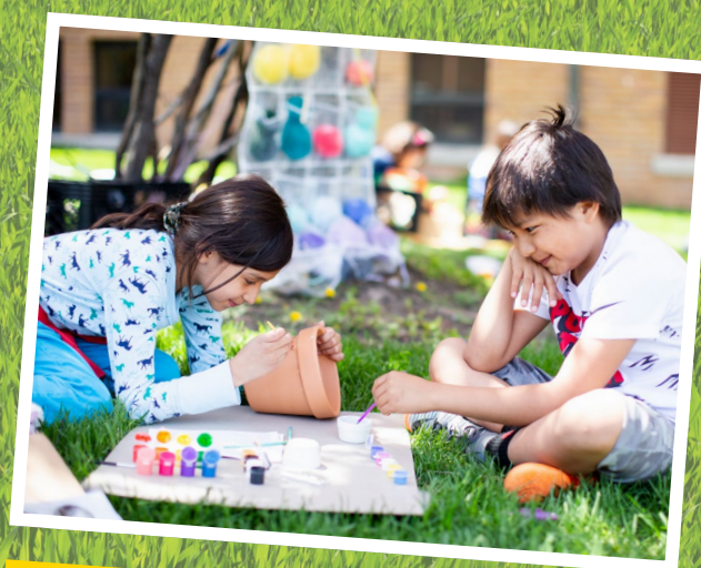
Auf dem grünen Gras zu spielen macht so viel Spaß!