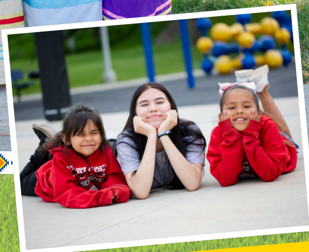
Danke Ihnen jederzeit sicher und geborgen.