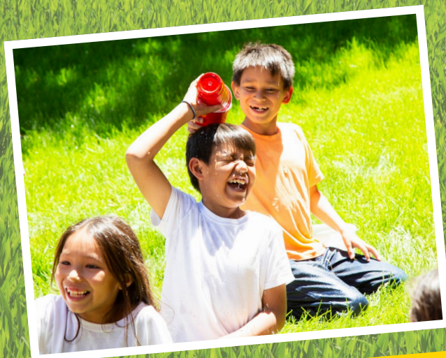
Das Glück wartet draußen!