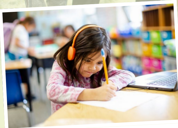
Bitte nicht stören, Konzentration ist gefragt!