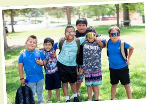
Danke, dass Sie uns Bildung schenken!