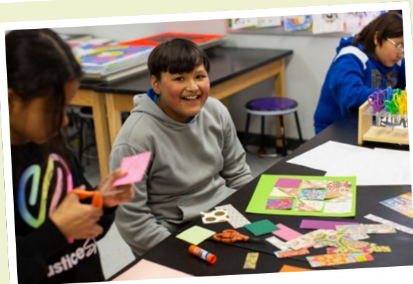
Wer sagt, Klassenräume könnten keinen Spaß machen?