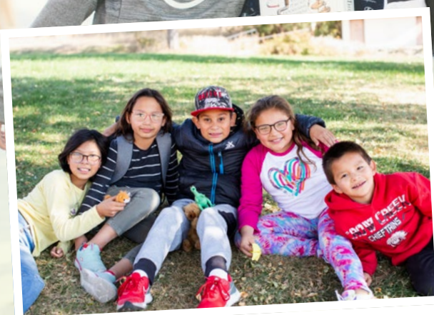
Die Ferienerlebnisse werden ausgetauscht.

Die Kinder freuen sich, wieder an der Schule zu sein, dank Ihnen!