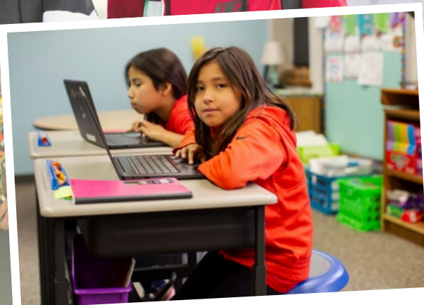
Bereit für einen neuen Schultag.