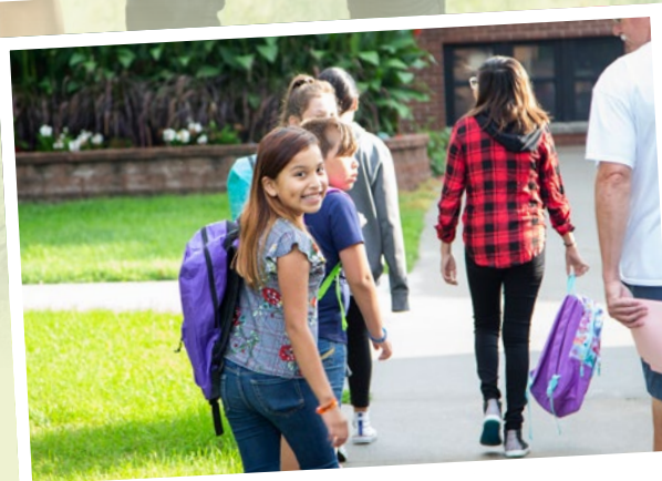
Lernen fürs Leben.