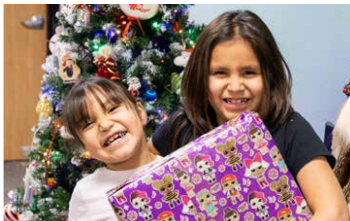
Weihnachtsgeschenke sind für alle Kinder mit Freude verbunden.

für die Kinder zu etwas Besonderem zu machen, ist ein wichtiger Teil davon – es schenkt ihnen innere Freude und Zufriedenheit.