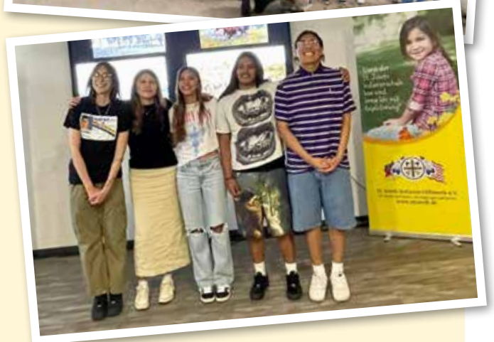
Die Schüler*innen beim Treffen mit Spendern in Frankfurt.